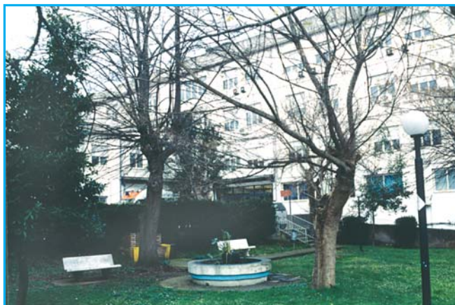
I giardini dell'Ospedale

Da lunedì a sabato dalle ore 8,00 alle 14,00