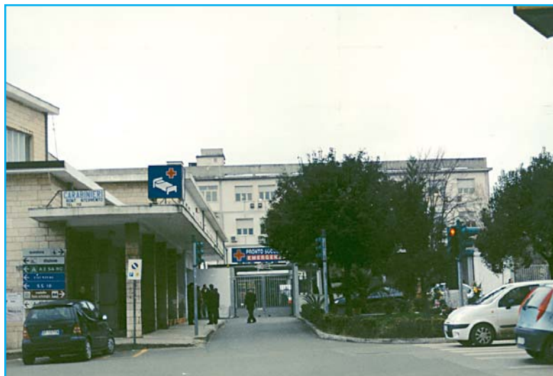
Presidio Ospedaliero di Vibo Valentia