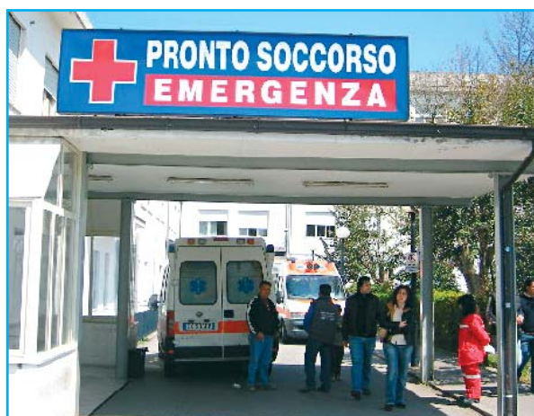
Il Pronto Soccorso