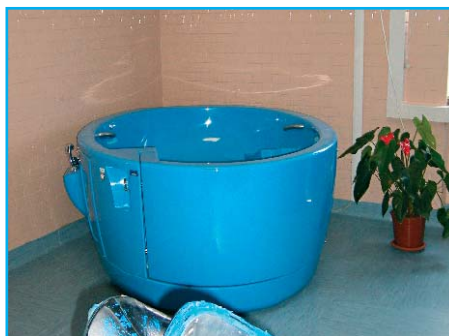
La vasca per il parto in acqua

Prenotazione tramite Numero Verde 800.131515