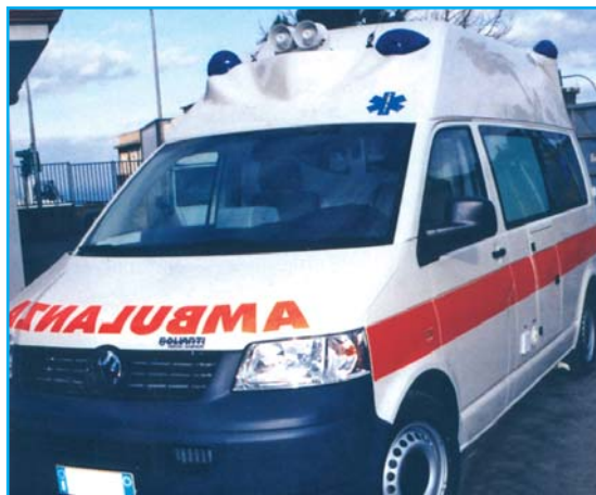
La nuova ambulanza