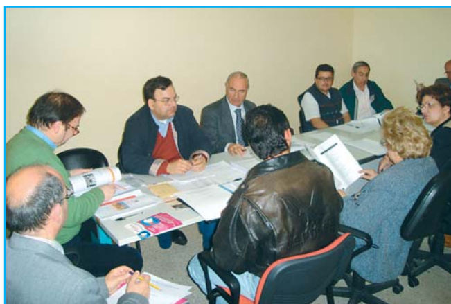
Incontro con le Associazioni di Volontariato e di Tutela

Gli impegni si riferiscono ai servizi ospedalieri e riguardano la dimensione della qualità dei servizi con particolare riferimento agli aspetti legati all'umanizzazione e alla personalizzazione; all'informazione e alla comunicazione; al comfort alberghiero e alla logistica.