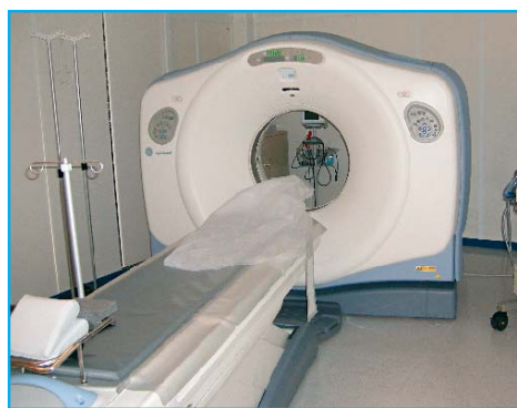
La nuova TAC

Il sistema consente la consegna degli esami radiologici su CD e l'archiviazione su dischi magnetici ottici.