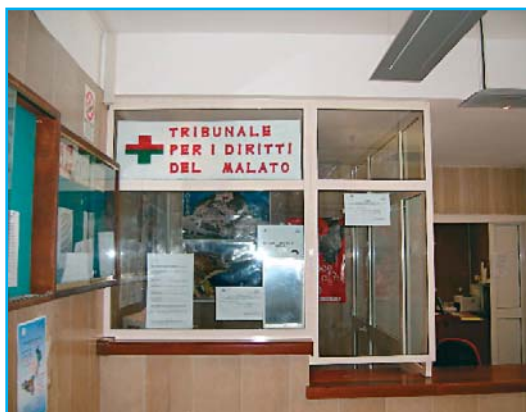
Il Tribunale Diritti del Malato

E-mail: cittadinanzattiva.vv@tiscali.it .