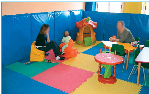
Il nuovo Reparto di Pediatria

Prenotazione tramite Numero Verde 800.131515.